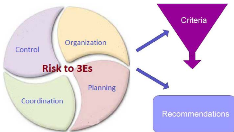
Gráfico 3: Correlación entre riesgos, criterios y recomendaciones