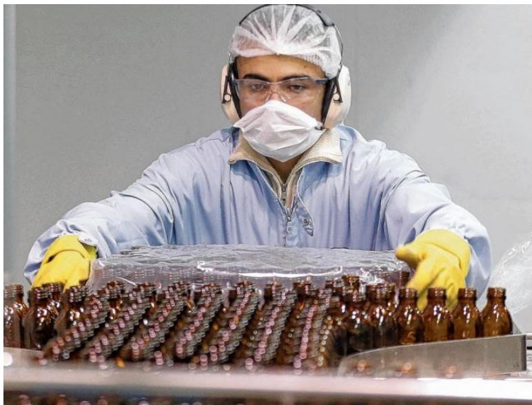
Temas de la industria farmacéutica, uno de los aspectos que quedaban pendientes.